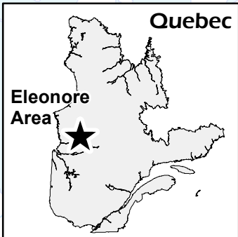
Figure 1 - Press release dated August 29, 2016