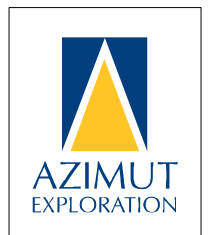
Figure 4 - Press release dated August 29, 2016