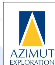
Figure 2 - Press release dated August 29, 2016